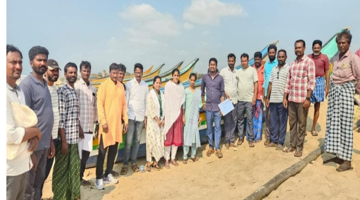
నక్కపల్లి, మార్చి 25, ప్రజా ప్రతిభ: