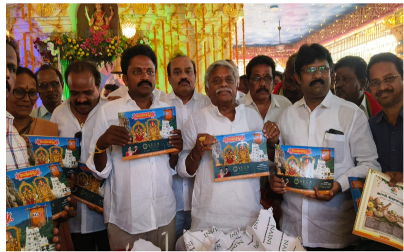
గోకవరం మార్చి 25 (ప్రజా ప్రతిభ స్పెషల్)