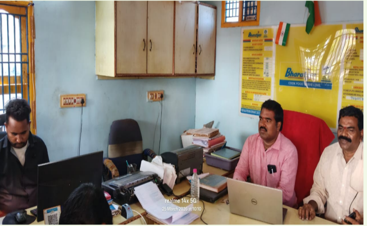
చిట్టమూరు మార్చి 25 ప్రజా ప్రతిభ