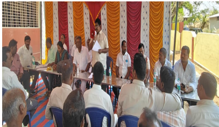
శాంతిపురం, మార్చి 25 ప్రజా ప్రతిభ: