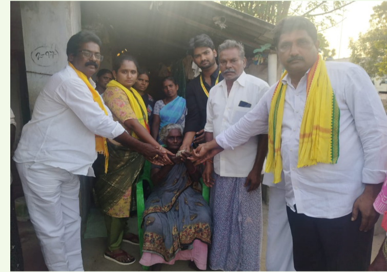
నెల్లూరు బ్యారో మార్చి 25 ప్రజా ప్రతిభ: