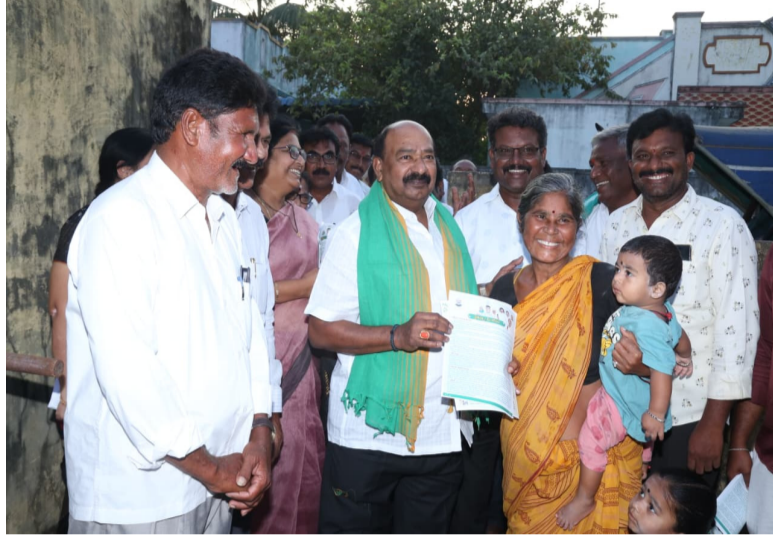
వెంకటగిరి, మార్చి 25 ప్రజా ప్రతిభ: