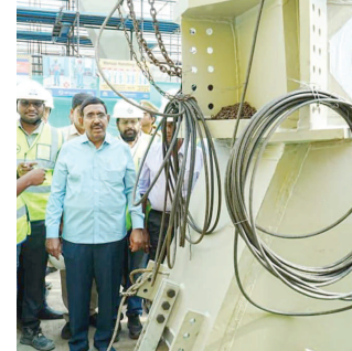
మోడల్ ఇచ్చారని చెప్పారు. ప్రజలు చెల్లించే పన్నుల నుంచి ఒక్క రూపాయి కూడా రాజధాని అమరావతికి ఖర్చు

వీటి నిర్మాణం జరుగుతోందన్నారు. బుధ వారం రాజధానిలో నిర్వహించిన హెచ్.డి. టవర్ -3 కార్యక్రమంలో వసులకు మంత్రి నారాయణ ప్రత్యేక వ్యాఖ్యలు నిర్వహించి, ప్రారంభించారు. అనంతరం మంత్రి మాట్లాడుతూ.. గత ఏడాది వర్షాలు అధికంగా కురవడంతో 4 నెలల పాటు ఈ పనులకు అనంతరం జరిగిందని పేర్కొన్నారు. బికానిక్ భవనాలు, ప్రజాప్రతినిధులు, అధికారుల నివాసాలు, మౌలిక సౌకర్యాలను పునరుద్ధరించే పనులకు మంత్రి నారాయణ వివరించారు. అమరావతి నిర్మాణానికి సీఎం చంద్రబాబు నాయుడు ప్రత్యేక హైనాన్స్