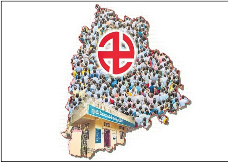
సంస్థల బ్యూరో మార్చి 25, ప్రజా ప్రతిభ స్పెషల్ :

సంస్థల బ్యూరో స్థానిక సంస్థల పాలకవర్గాలకు ఒక్కొక్కటిగా గడువు ముగిస్తోంది. ఇప్పటికే కార్పొరేషన్, మున్సిపాలిటీల్లో పాలకవర్గాల గడువు ముగిసిన సంగతి తెలిసిందే. అధికారుల పాలన మొదలైంది. ఎన్నికల వెంటనే జరిపేందుకు రాష్ట్ర ప్రభుత్వం ఏర్పాట్లు చేయలేదు. వచ్చే ఆరు నెలల్లో స్థానిక ఎన్నికలు నిర్వహించనున్నట్లు ముఖ్యమంత్రి చంద్రబాబునాయుడు స్పష్టం చేశారు. ఈ క్రమంలో ఎన్నికల బరిలో నిలిచేందుకు అభ్యర్థులు సన్నాహాలు చేసుకుంటున్నారు. పురపాలక సంఘాలు, నగర పంచాయతీల పాలకవర్గాల పదవీకాలం ఇప్పటికే ముగిసింది. పంచాయతీల పదవీకాలం వచ్చే నెల 6న ముగియనుంది. సెప్టెంబర్లో మండల, జిల్లా ప్రజా పరిషత్తుల పదవీకాలం