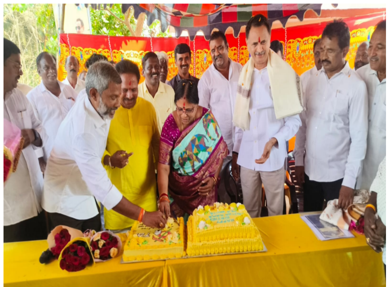
స్థానిక ప్రజలు పాల్గొని ఎమ్మెల్యేకు జన్మదిన శుభాకాంక్షలు తెలియజేశారు. ఈ కార్యక్రమంలో వేపాడ మరయ దేవరావు కూటమి నాయకులు కార్యకర్తలు పాల్గొన్నారు.