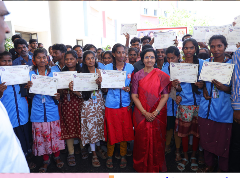
పరిశ్రమల రాకతో స్థానిక యువతకు ఉద్యోగ అవకాశాలు