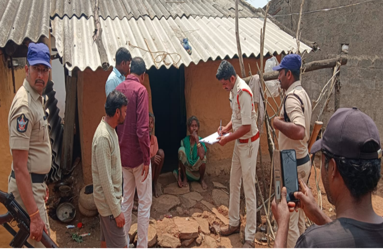
దుండ్రుగూడ న్యూస్ : అరకు లోయ, ఏప్రిల్ 01( ప్రజా ప్రతిభ ):