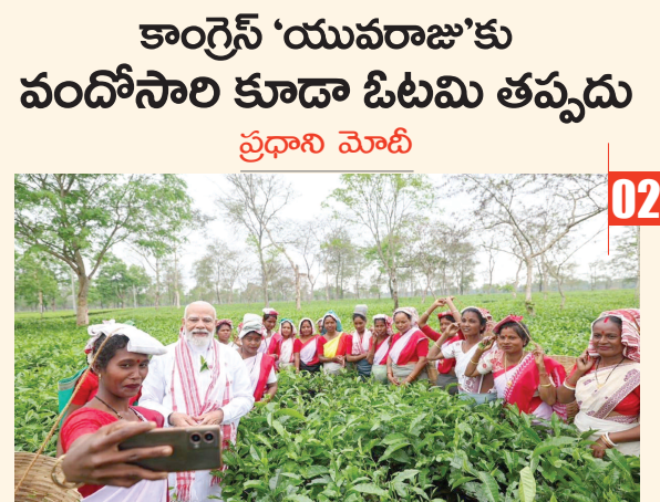
కాంగ్రెస్ 'యువరాజు'కు వందోసారి కూడా ఓటమి తప్పదు ప్రధాని మోదీ