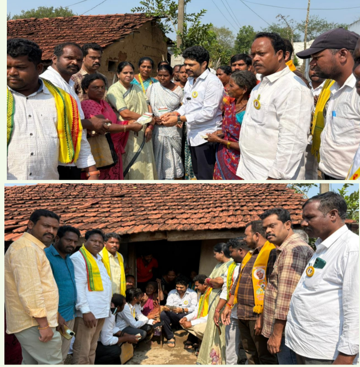
హంకంపేట, న్యూస్ : అరకు లోయ, ఏప్రిల్ 01( ప్రజా ప్రతిభ ):