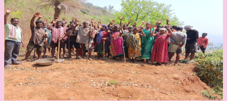
అనంతగిరి, న్యూస్: అరకు లోయ, ఏప్రిల్ 01, ( ప్రజా ప్రతిభ ):