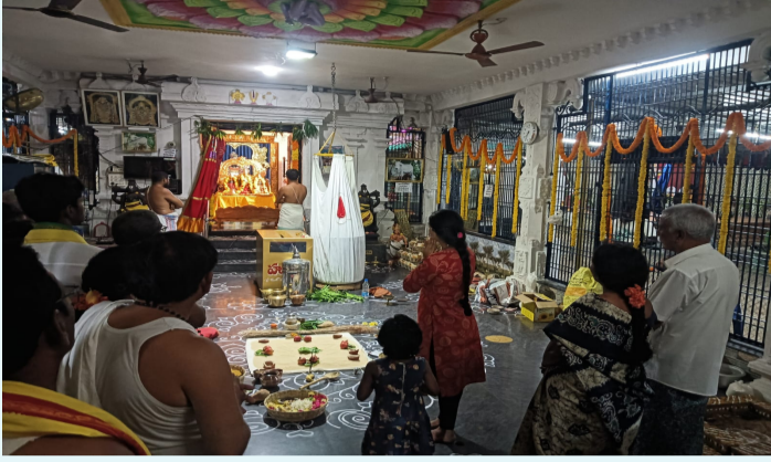
గోకవరం ఏప్రిల్ 01 (ప్రజా ప్రతిభా న్యూస్)