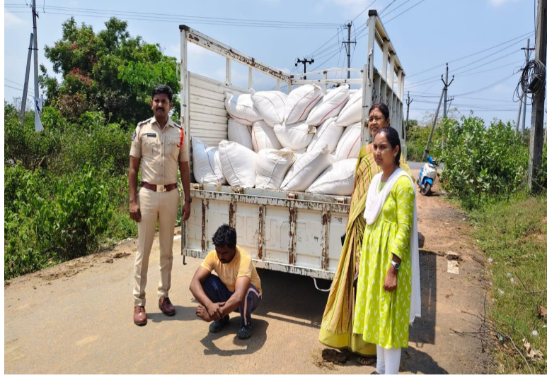
జీలుగుమిల్లి, ఏప్రిల్ 01 (ప్రజా ప్రతిభ) :

ప్రభుత్వం పేదలకు పంపిణీ చేయాల్సిన రేషన్ బియ్యాన్ని అక్రమంగా తరలిస్తున్న ఘటనను జీలుగుమిల్లి పోలీసులు వెలికితీశారు. సి.ఎన్.డి.టి సిబ్బందికి అందిన సమాచారం మేరకు పోలీసులు