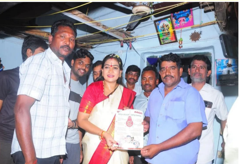
నక్కపల్లి, ఏప్రిల్ 1, (ప్రజా ప్రతిభ) :

పాయకరావుపేట నియోజకవర్గంలో హోం మంత్రి వంగలపూడి అనిత మంగళవారం విస్తృతంగా పర్యటించారు. నక్కపల్లి చేరుకున్న మంత్రికి స్థానిక మహిళలు పూలమాలలు, మంగళహారతులతో ఘన స్వాగతం పలికారు. పార్టీ శ్రేణులు, ప్రజాప్రతినిధులు పెద్ద ఎత్తున తరలివచ్చి మంత్రికి స్వాగతం పలికారు. అనంతరం మంత్రి అనిత నక్కపల్లిలో ఇంటింటికి తిరుగుతూ లబ్ధిదారులకు స్వయంగా పింఛన్ను పంపిణీ చేశారు. వృద్ధులు, వితంతువులు, దివ్యాంగులను ఆప్యాయంగా పలకరించి వారి యోగక్షేమాలు అడిగి తెలుసుకున్నారు. ప్రభుత్వం అందిస్తున్న పింఛన్ను సకాలంలో అందుతున్నాయా