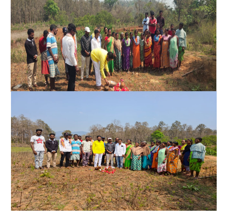
రం పచోడవరం డివిజన్ ప్రజా ప్రతిభ ఏప్రిల్ 01