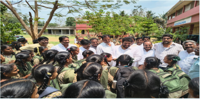
గోకవరం ఏప్రిల్ 01 (ప్రజా ప్రతిభా న్యూస్)