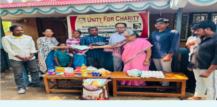
అల్లూరి జిల్లా చుంత్రగూడ, ఏప్రిల్ 1 (ప్రజా ప్రతిభా)