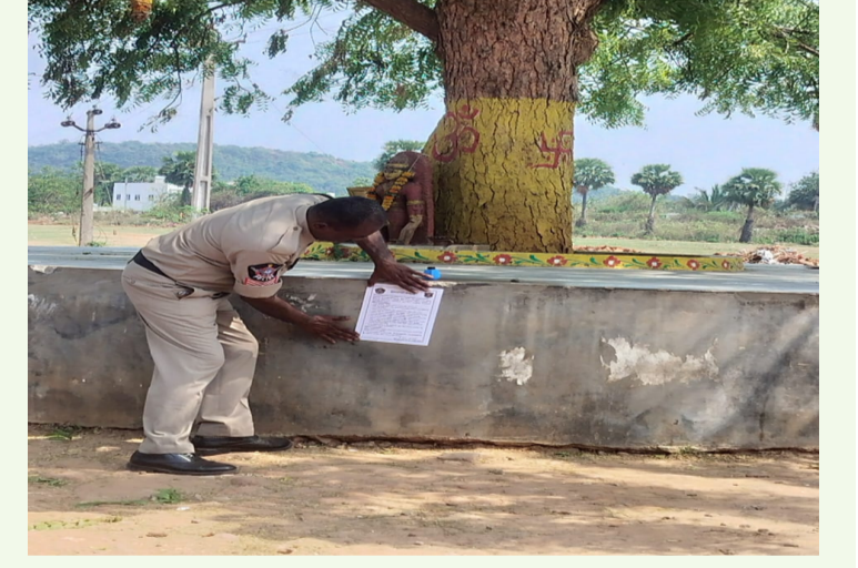
అసకాపల్లి బ్యారో/ఎలమంచిలి ప్రజా ప్రతిభ ఏప్రిల్ 1: