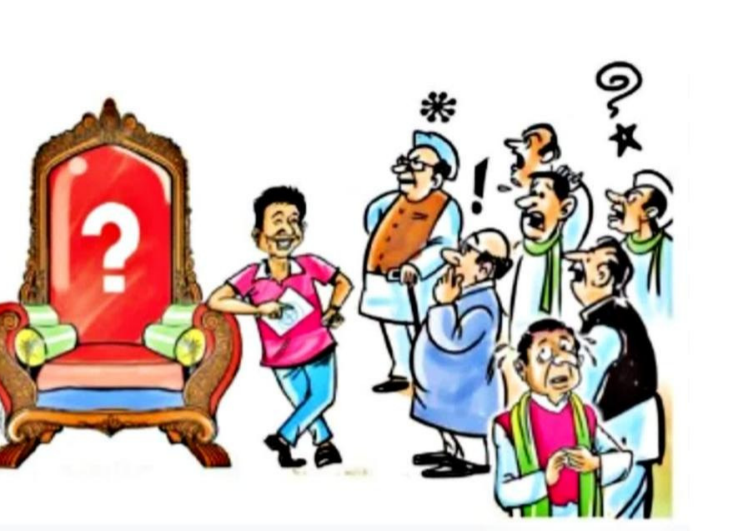
సంద్యాల జ్యూరో ఏప్రిల్ 1, (ప్రజా ప్రతిభా) :

సంద్యాల జిల్లాలోని మండలంలో గ్రామ పంచాయతీల పాలకవర్గాల పదవీ కాలం రెండో నేటితో ముగియనుండడంతో దాని పాలన తీరు మార నుంది. సర్పంచులు, వార్డు సభ్యులతో కూడిన పాలకవర్గం రద్దు కావడంతో ఇక నుంచి గ్రామ పంచాయతీలకు ప్రత్యేకాధికారులను నియమించి పాలన సాగించా అని ప్రభుత్వం నిర్ణయించింది. సంద్యాల జిల్లాలో 3 రెవెన్యూ డివిజన్లు, 27 రెవెన్యూ మండలాలు 26 మండల పరిషత్లు, 5 మునిసిపాలిటీలు, 1 నగర పంచాయతీలు 454 గ్రామ పంచాయతీలు, 417 రెవెన్యూ గ్రామాలు ఉన్నాయి. జిల్లాలో ఉండే అన్ని పంచాయతీ పాలక మండలి పదవీకాలం నేటితో పదవికాలం ముగియనున్న తరహాలో రేపటి నుంచి ప్రత్యేక అధికారులతో పంచాయతీల పాలనకు తెరతీసింది. పంచాయతీ ఎన్నికలు సెప్టెంబర్ నిర్వహించనున్నట్లు, ఆలోగా అందుకు సంబంధించిన ప్రక్రియ పూర్తిచేయాలంటూ, ఆరు నెలల వ్యవధితో స్థానిక ఎన్నికలను నిర్వహించనున్నట్లు ఈ నెల 13న జరిగిన రాష్ట్ర క్యాబినెట్ సమావేశంలో సీఎం చంద్రబాబు నాయుడు తెలిపారు. ఈ నేపథ్యంలో ఈ ఆరు నెలల కాలంలో మునిసిపాలిటీల్లో పలు అభివృద్ధి కార్యక్రమాలు జోరందుకోవచ్చునని పట్టణవాసులు భావిస్తున్నారు. మరోవైపు రాష్ట్ర ఎన్నికల కమిషన్ ఆదేశాల మేరకు మునిసిపాలిటీల్లో ఓటర్ జాబితా రూపొందించే కార్యక్రమం తుది దశకు చేరింది.