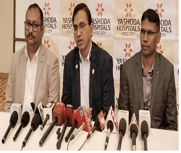
రాజమహేంద్రవరం, ఏప్రిల్ 01 (ప్రజా ప్రతిభా) :

- పార్శ్వాన్ బాధితులకు యశోద హాస్పిటల్స్ పునర్జన్మ - అధునాతన డిజిఎస్ సర్జరీతో కదలికల్లో కొత్త వేగం