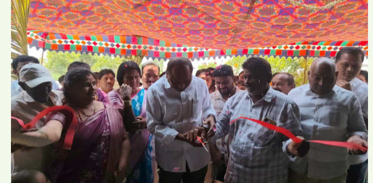
ప్రకాశం జిల్లా బ్యారో / కుందురు శ్రీనివాసరెడ్డి, ఏప్రిల్ 23, (ప్రజా ప్రతిభ):

- ముఖ్య అతిథి గా, యర్రగొండపాలెం ఎమ్మెల్యే తాటిపల్లి చంద్రశేఖర్