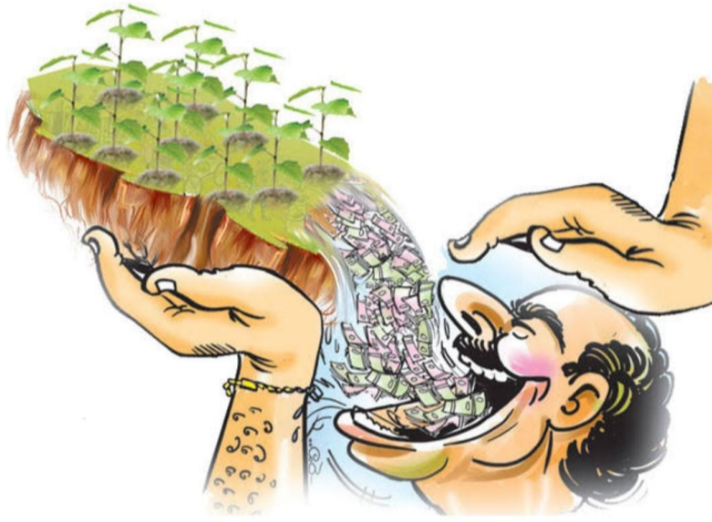
నంద్యాల జ్యూరీ ఏప్రిల్ 23, ప్రజా ప్రతిభ :

నంద్యాల జిల్లా నందికొట్లూరు నియోజకవర్గం పగలు రేయి తేడా లేకుండా నదీ తీర ప్రాంతంలో అక్రమ తవ్వకాలు అగేదవుతున్నాయి. ప్రభుత్వ ఆస్తులు, ముఖ్యంగా శ్రీశైలం ప్రాజెక్టు సంబంధించిన విలువైన భూములు అక్రమార్కులకు కాసులు కురిపించే గనులుగా మారిపోయాయో అనే తలంపులు ప్రజలు నుంచి వస్తున్నాయి. నందికొట్లూరు మండలం శాతనకాండ గ్రామంలో గత నాలుగు రోజులుగా నల్లమట్టి దోపిడీ యధేచ్ఛగా సాగుతుంటే పట్టించుకునే నాభుడే లేదా? రాజకీయ నాయకుల అండదండల పుష్పలంగా ఉండటంతో, ఎటువంటి అనుమతులు లేకుండానే నదీ తీర ప్రాంతాల్లో ఎక్స్కవేషన్లు (పొక్షయిత్తు) పెట్టి మరీ మట్టిని తవ్వేస్తుంటే యంత్రాంగం ఏం చేస్తోంది.