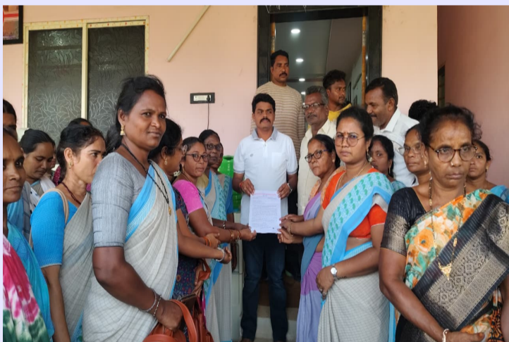
జీలుగుపల్లి, ఏప్రిల్ 23 (ప్రజా ప్రతిభ) :

పోలవరం నియోజకవర్గంలోని బర్లింకలపాడు క్యాంపు కార్యాలయంలో అంగన్వాడీ వర్కర్లు, సహాయకులు, మినీ వర్కర్లు తమ సమస్యల పరిష్కారం కోసం వినతి వ్రతం సమర్పించారు. వేతనాల పెంపు, వేసవి సెలవుల మంజూరు వంటి ప్రధాన అంశాలపై చర్చలు తీసుకోవాలని కోరారు. ఈ సందర్భంగా సిబ్బంది తమ సమస్యలను వివరంగా తెలియజేశారు. 2019 నుంచి ఇప్పటివరకు వేతనాల్లో ఎలాంటి పెంపు జరగలేదని, ఇదే సమయంలో నిత్యావసర వస్తువుల ధరలు పెరగడంతో జీవనం కష్టంగా మారినది తెలిపారు. తక్కువ వేతనాలతో కుటుంబాలను పోషించడం కష్టమవుతున్నదని, ప్రస్తుతం తీవ్ర ఆర్థిక ఇబ్బందులు ఎదురవుతున్నాయని పేర్కొన్నారు. తమ పరిస్థితిని ప్రభుత్వం గుర్తించి తక్షణమే వేతనాలను పెంచేలా చర్యలు తీసుకోవాలని విజ్ఞప్తి చేశారు. చిన్నారుల సంరక్షణలో కీలక బాధ్యతలు నిర్వహిస్తున్నప్పటికీ తగిన గుర్తింపు, ఆర్థిక భద్రత లభించడం లేదని ఆవేదన వ్యక్తం చేశారు. ఇక ఎండల తీవ్రత పెరుగుతున్న నేపథ్యంలో అంగన్వాడీ కేంద్రాలకు చిన్నారులు హాజరు కావడం కష్టంగా మారినది తెలిపారు. చిన్నారుల ఆరోగ్యం దృష్ట్యా మే నెల మొత్తం వేసవి సెలవులు మంజూరు చేయాలని కోరారు. ఈ నిర్ణయం తీసుకుంటే పిల్లలకు, సిబ్బందికి ఉపశమనం కలుగుతుందని పేర్కొన్నారు. ఈ రెండు ప్రధాన డిమాండ్లపై ప్రభుత్వం సానుకూల నిర్ణయం తీసుకునేలా చర్యలు తీసుకోవాలని వినతి వ్రతం అందజేశారు. సమస్యలను ప్రభుత్వ దృష్టికి తీసుకెళ్లి పరిష్కారం కోసం కృషి చేస్తానని హామీ ఇచ్చినట్లు తెలిపారు. ఈ కార్యక్రమంలో కార్యక సంఘం నాయకులు, ప్రాజెక్టు సిబ్బంది, అంగన్వాడీ సిబ్బంది పాల్గొన్నారు.