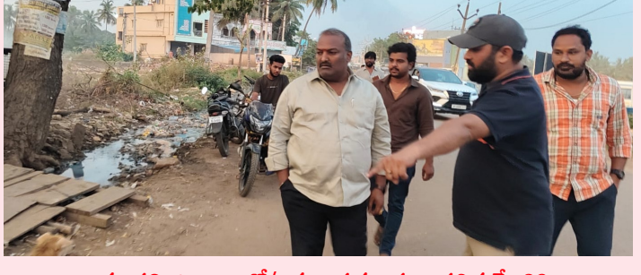
అసకాపల్లి జిల్లా డ్యూటీ/అచ్యుతాపురం ప్రజా ప్రతిభ మే 26:

అధికారులు తీరుపై అసంతృప్తి వ్యక్తం ప్రజా ఆరోగ్యానికి భంగం కలిగిస్తే చర్యలు: ఎమ్మెల్యే విజయ్ కుమార్ హెచ్చరిక