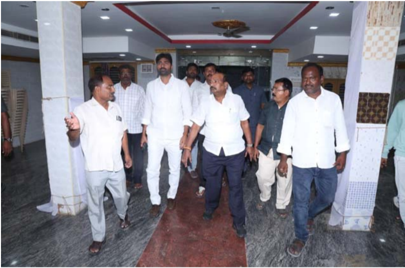
వెంకటగిరి, మే 26(ప్రజా ప్రతిభ):