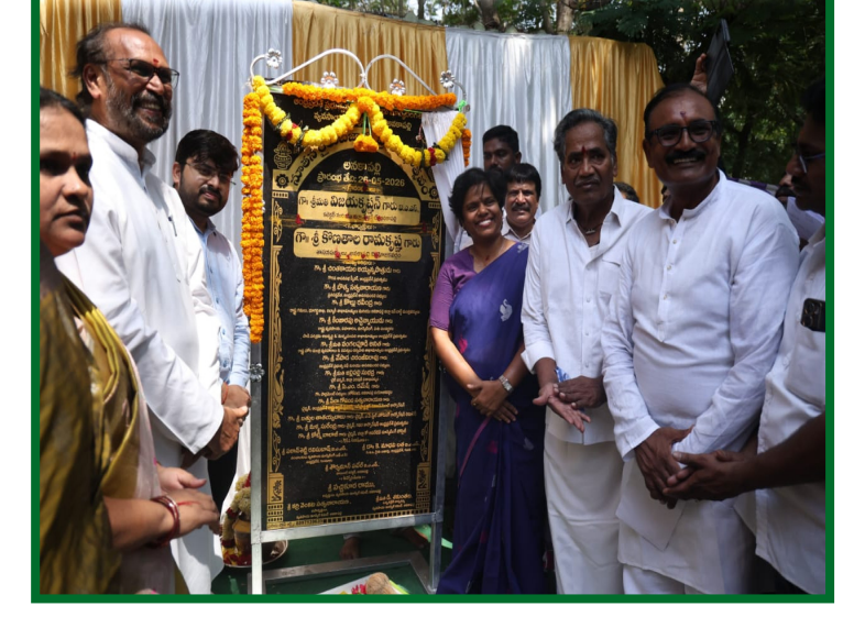
అనకాపల్లి జిల్లా బ్యారో/ఎలమంచిలి ప్రజా ప్రతిభ మే 26:

రూ.15 లక్షల వ్యయంతో ఆధునిక సౌకర్యాలతో నిర్మాణం జిల్లా కలెక్టర్ విజయ క్రిష్ణన్