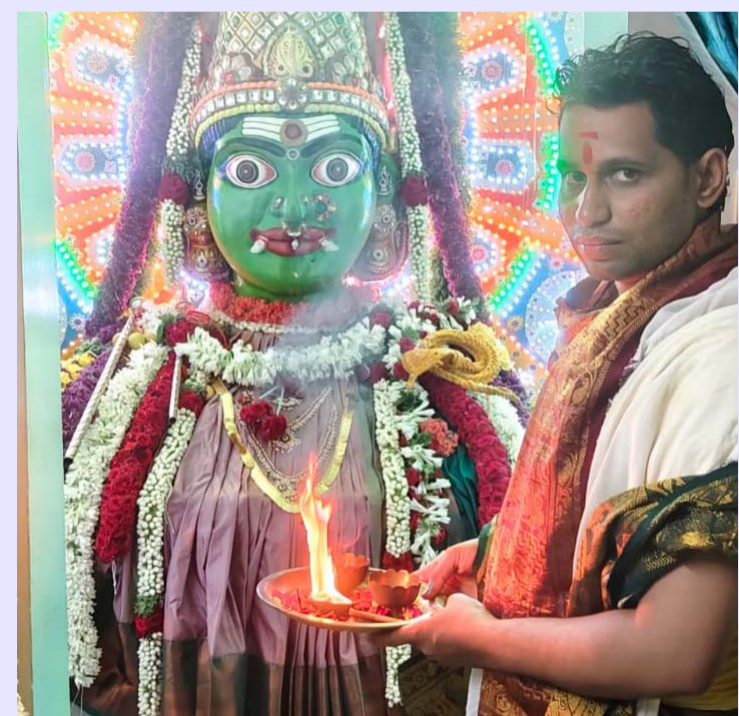
కుప్పం, మే 26, (ప్రజా ప్రతిభ):