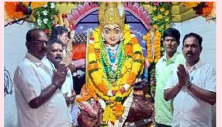
మాడుగుల, మే 26 ప్రజా ప్రతిభ: