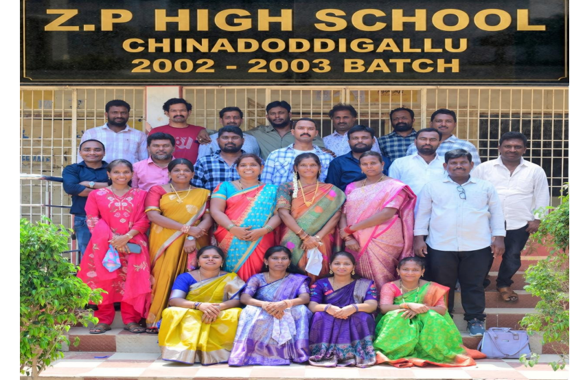
సకృష్ణ, మే 26, (ప్రజా ప్రతిభ) :

చిన్ననాటి జ్ఞాపకాలను నెమరువేసుకున్న చినదొడ్డిగల్లు జెడ్పీహెచ్ఎస్ పూర్వ విద్యార్థులు