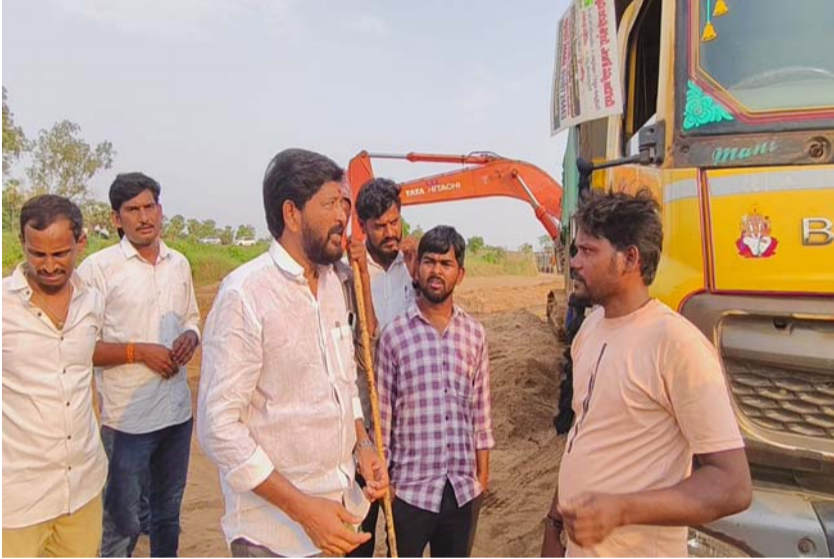
గోకవరం మే 26 (ప్రజా ప్రతిభ స్పాస్)

పాటంచెట్టి సూర్యచంద్ర ఇండిపెండెంట్ ఎమ్మెల్యే అభ్యర్థి