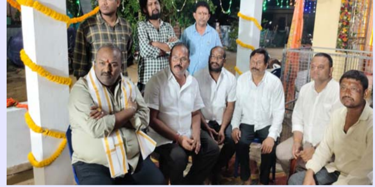
అమ్మతాపురం ప్రజా ప్రతిభ మే 26: