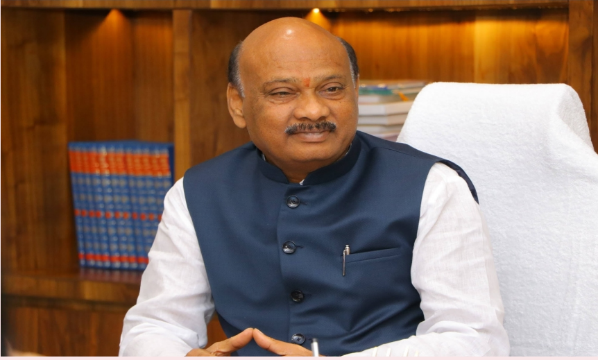
గొలుగొండ, మే 26 (ప్రజా ప్రతిభ)

సభాపతి అయ్యన్నచౌరవతో రూ. 1.93 కోట్ల నిధులు విడుదల.