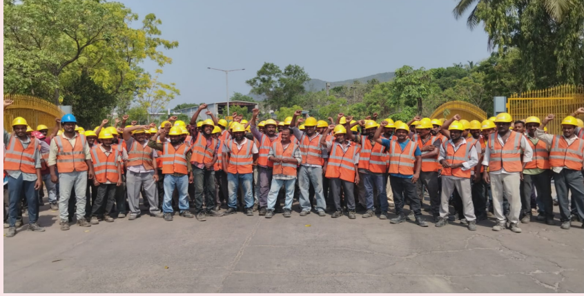
అనకాపల్లి జిల్లా బ్యారో/ఎలమంచిలి ప్రజా ప్రతిభ మే 26:

వేతనాలు పెంచాలంటూ కాంట్రాక్ట్ కార్మికులు ఎలమంచిలి మండలం ములకలాపల్లి మై హోమ్ సిమెంట్ ఫ్యాక్టరీ మెయిన్ గేట్ వద్ద మంగళవారం నిరసనకు దిగారు. అంతేకాకుండా వారాంతపు సెలవుల సైతం ఇవ్వకుండా గత రెండు సంవత్సరాలుగా అవే వేతనాలు కొనసాగిస్తున్నారని ఆందోళన వ్యక్తం చేశారు. ముఖ్యంగా సిమెంట్ ఫ్యాక్టరీలో వివిధ కాంట్రాక్టర్ల వద్ద 500 మందికి పైగా కార్మికులు పనిచేస్తున్నారని కార్మికుల కక్షం కనిపించడం లేదని ఆవేదన వ్యక్తం చేస్తారు. విధులలో చేరి సంవత్సరాలు గడుస్తున్నప్పటికీ అవే వేతనాల కొనసాగించడంతోపాటు స్ట్రెస్ కార్మికులకు 703 రూపాయలు, సెమీ కిల్డ్ పర్సన్లకు 560 రూపాయలు అన్నిల్లో పర్సన్లకు 470 రూపాయలు ఇస్తూ ముస్తూర విధానంలోనే కొనసాగిస్తున్నారని తెలిపారు. ఈ నేపథ్యంలో కంపెనీ యజమాన్యం రోజుకు 9 రూపాయలు చొప్పున వేతనం పెంపు చేస్తామని ఇది జూన్ నెల నుండి అమలు అవుతుందని ప్రకటించడంతో ఈ విధానం చచ్చిన కార్మికులు విధులను బహిష్కరించి తమ నిరసన వ్యక్తం చేశారు. అంతేకాకుండా కార్మికుల భద్రత ప్రయోజనాలు దృష్టిలో యూనియన్ ఏర్పాటుకు అవకాశం కల్పించాలని డిమాండ్ చేశారు. ఇప్పటికైనా పూర్తిస్థాయిలో కష్టపడ కార్మికులకు తగిన గుర్తింపు ఇవ్వాలని సీనియారిటీని బట్టి స్థాయి పెంపు జరగాలని కోరారు.