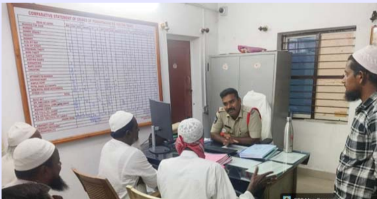
పెద్దపంజాణి మే 26(ప్రజాప్రతిభ):

పెద్దపంజాణి మండలంలోని రానున్న బక్రీద్ పండుగను పురస్కరించుకొని పెద్దపంజాణి పోలీస్ స్టేషన్ ఆధ్వర్యంలో మున్సిం పెద్దపంజాణి శాంతి కమిటీ సమావేశం నిర్వహించారు. ఈ సమావేశంలో పండుగను ప్రశాంత వాతావరణంలో, సామరస్యపూర్వకంగా నిర్వహించుకోవాలని పోలీసులు సూచించారు. ఈ సందర్భంగా ఎస్సై మాట్లాడుతూ అన్ని వర్గాల ప్రజలు పరస్పర సహకారంతో పండుగను జరుపుకోవాలని తెలిపారు. చట్టాలను పాటించి శాంతి భద్రతల పరిరక్షణలో పోలీసులకు సహకరించాలని కోరారు. ఎలాంటి అపోహలు, వివాదాలకు తావు లేకుండా సామాజిక ఐక్యతను కాపాడాలని సూచించారు. అలాగే ప్రజలు అప్రమత్తంగా ఉండి అనుమానాస్పద ఘటనలు గమనించిన వెంటనే పోలీసులకు సమాచారం అందించాలని తెలిపారు. ఈ సమావేశంలో మున్సిం పెద్దపంజాణి ప్రముఖులు మరియు పోలీస్ సిబ్బంది పాల్గొన్నారు.