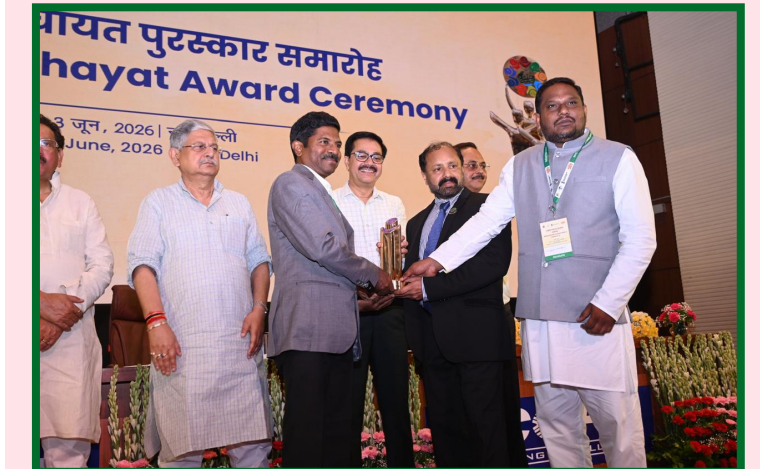
నాతవరం, జూన్, 03, ప్రజా ప్రతిభ