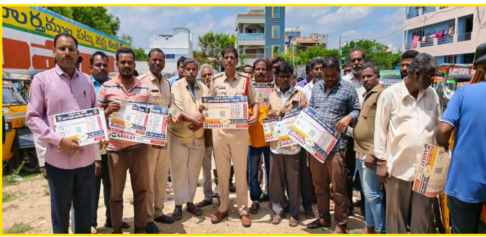
బంగారు పాళ్ళం జూన్ 3, (ప్రజా ప్రతిభ)