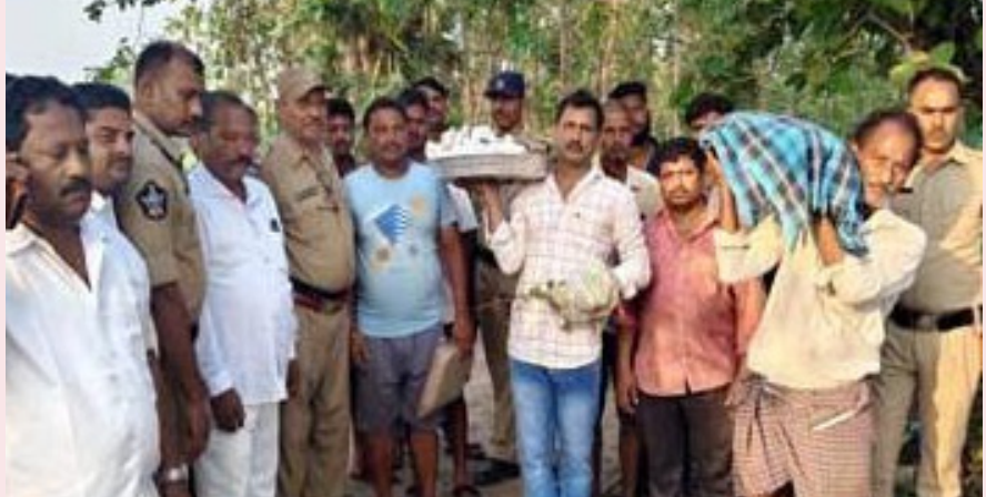
మాడుగుల, జూన్ 3 ప్రజా ప్రతిభ:

మానవత్వాన్ని చాటుకున్న అనకాపల్లి జిల్లా పోలీసులు