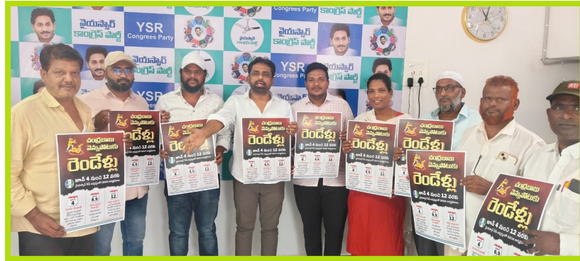
సందికొట్లూరు, జూన్ 03, (ప్రజా ప్రతిభ):