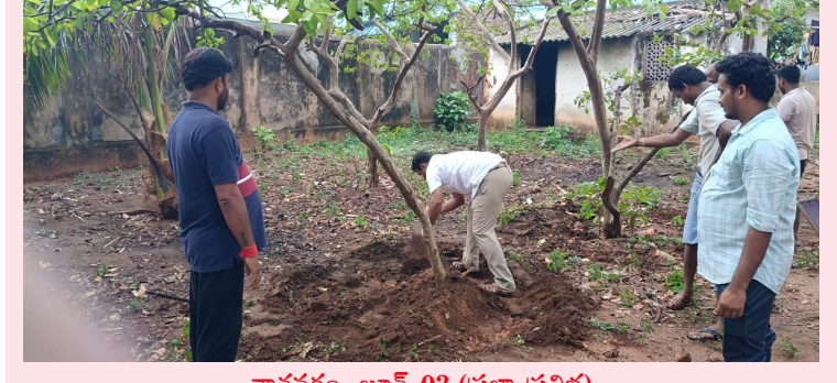
నాతవరం, జూన్ 03, ప్రజా ప్రతిభ