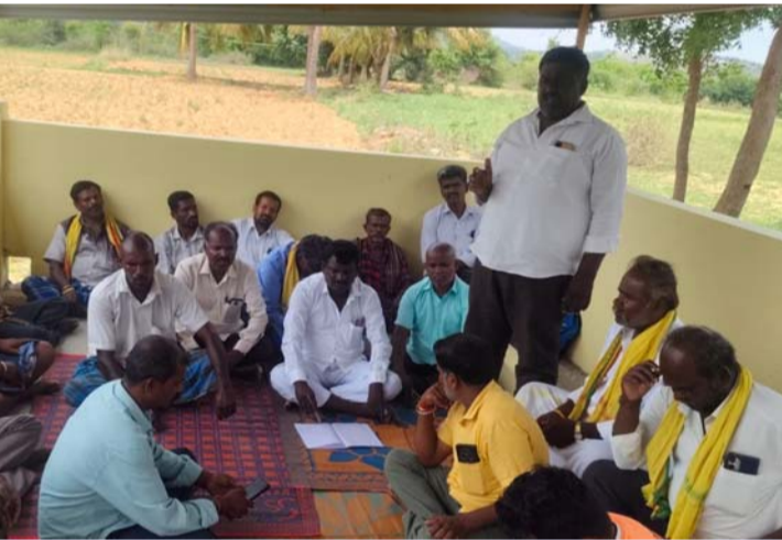
గుడుపల్లి జూన్ 03 ప్రజా ప్రతిభ :-