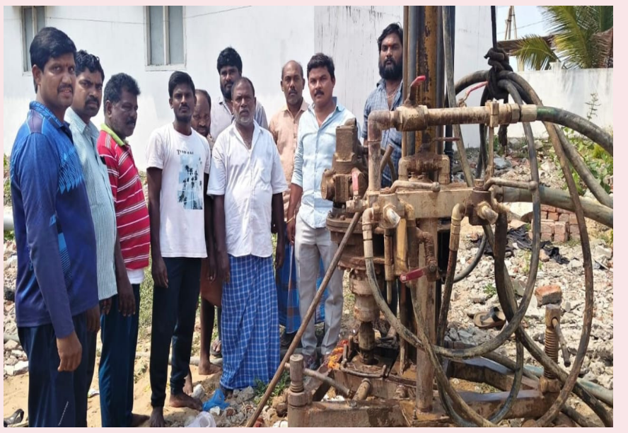
ఎస్ రాయవరం, జూన్ 3, (ప్రజా ప్రతిభ) :

రూ.2 లక్షలతో బోరు, ట్యాంక్ పనులు ప్రారంభం