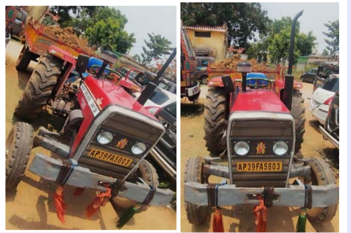
విశాఖ ఉమ్మడి జిల్లా బ్యారో, ఆనకాపల్లి కసింకోట, జూన్ 3

రెండు ట్రాక్టర్లు పట్టివేత.. మైన్స్ శాఖకు అప్పగించే