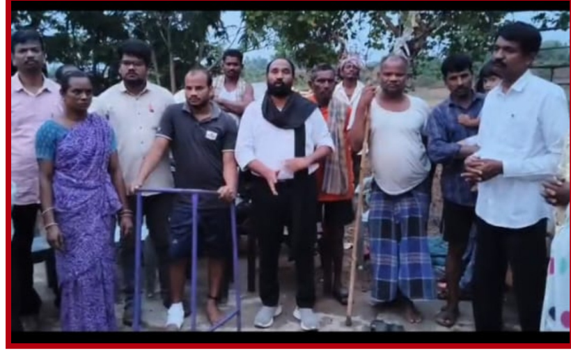
ఇప్పుడు, పాలు, తాగునీరు అందకుండా పూర్తి స్థాయిలో సామాజిక బహిష్కరణ చేశారని, బాధితులు తక్షణమే పోలీసులను ఆశ్రయించినప్పటికీ, పోలీసులు మరియు ప్రజాప్రతినిధులు నిందితులకు కొమ్ముకాస్తూ ఏకపక్షంగా వ్యవహరించారని, అధికార, సామాజిక బలంతో కొప్పులవెలమ సామాజికవర్గం పెద్దలు అధికార యంత్రాంగాన్ని వ్యవస్థలను మేనేజ్ చేయడం వల్ల బాధితులమైన మాకు న్యాయం జరగలేదని మీడియా పరంగా తెలియజేశారు