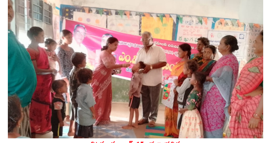
చిట్టమూరు జూన్ 15, ప్రజా ప్రతిభ

అంగన్వాడీ కేంద్రం చిన్నారులకు చాపలు, విద్యా సామాగ్రి పంపిణీ.