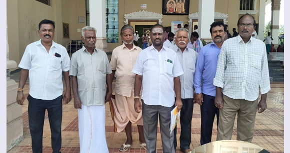
వెంకటగిరి, జూన్ 15 (ప్రజా ప్రతిభ):