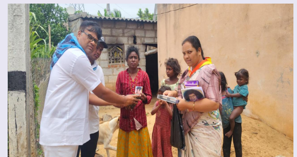
పెద్దపంజాణి జూన్ 15 (ప్రజా ప్రతిభ).