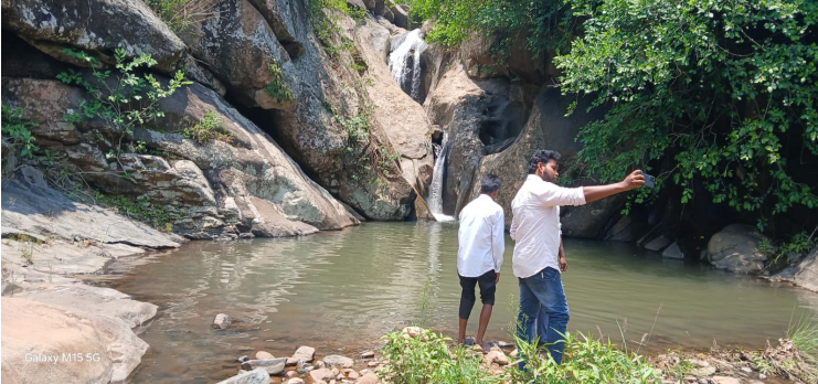
అధికంగా బలోపేతం కావడానికి ఎంతో ఉపయోగపడుతుందన్నారు అలాగే ఈ జలపాతానికి సందర్భించే పర్యాటకులు దమ్యకునుండి వాలానికి 16 కిలోమీటర్లు దూరం ప్రయాణిస్తే 30 నిమిషాల్లో ఎత్తైన పర్వతాల లోయలు ఎంతో ఆకర్షణీయంగా మైమరిపించి కనువిందు చేస్తాయని ఆయన పేర్కొన్నారు. పర్యాటకులు ఆస్వాదించడానికి ఫాస్ట్ ఫుడ్ సౌకర్యం లెంట్ సౌకర్యం గిరిజన సాంప్రదాయ నృత్యం దినా ఆట పాటలతో సందడి వాతావరణం లో సేద తీర్చే అవకాశం లభిస్తుందన్నారు.