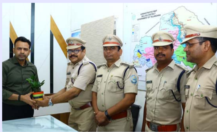
ములుగు జిల్లా బ్యారో, జూన్ 4, ప్రజా ప్రతిభ

- ముఖ్య అతిథులుగా హాజరుకానున్న ప్రజాప్రతినిధులు, అధికారులు