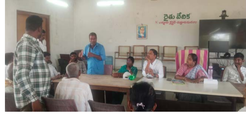
ఇందిరమ్మ ఇండ్ల లొల్లి...