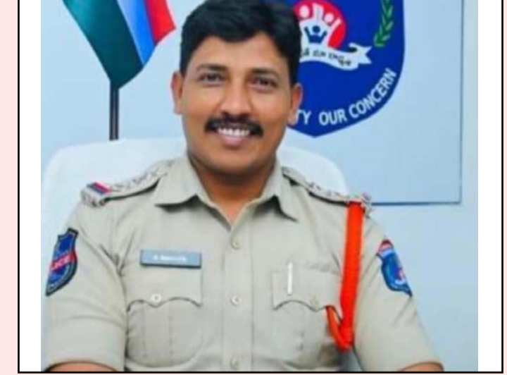
మేడ్చల్ ప్రతినిధి, జూన్ 04 (ప్రజా ప్రతిభ)