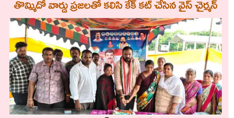
వైరా జూన్ 4 ప్రజా ప్రతిభ