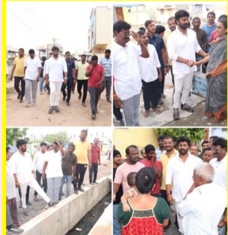
రామగుండం జూన్ 04 (ప్రజా ప్రతిభ)

రామగుండం ఎమ్మెల్యే రాజ్ తాగూర్ ఉత్తర తెలంగాణలోనే ఆదర్శవంతమైన నగరంగా తీర్చిదిద్దేందుకు కృషి చేస్తాను రామగుండం ఎమ్మెల్యే రాజ్ తాగూర్