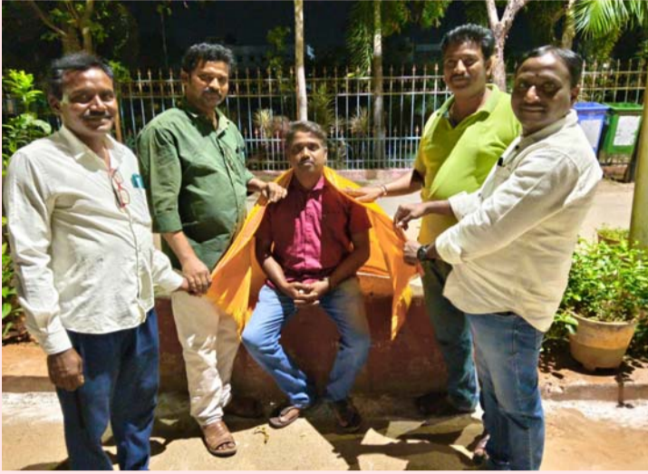
హుజూరాబాద్ ప్రతినిధి, జూన్ 04, ప్రజా ప్రతిభ: