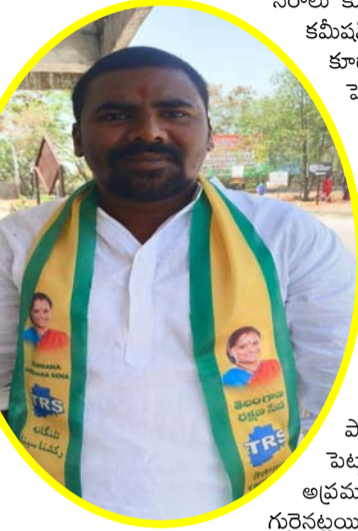
సైబర్ నేరాలకు గురైతే వెంటనే 1930కు ఫిర్యాదు చేయాలి