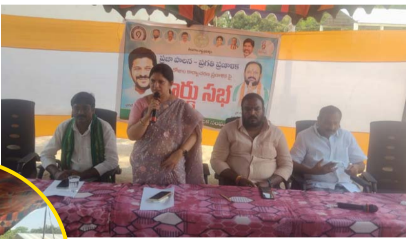
మాట్లాడి సమస్యలను పరిష్కరించే దిశగా గా ముందుకు వెళ్లారు రెవెన్యూ సిబ్బంది సర్ ప్రోగ్రాం పై అవగాహన కల్పిస్తూ ఓట్ల లిస్టులో ఉన్న ఓటర్ జాబితా చూసుకోవాలని తెలియజేశారు అలాగే ఆ వార్డులకు సంబంధించి ఇందిరమ్మ ఇళ్లపై కూడా ఉన్న బిల్లుల యొక్క సమస్యలను వీలైనంత త్వరగా తీరుస్తామని అధికారులు తెలిపారు పెన్షన్ దారుల గురించి మాట్లాడుతూ 56 సంవత్సరాలు నిండి ఉన్న ప్రతి ఒక్కరికీ పెన్షన్ వస్తుందని ఒక్కసారి అప్లై చేసుకుంటే మళ్ళీ చేసుకోవాల్సిన అవసరం లేదని ఒకవేళ అప్లై చేసుకోవడం ఇప్పుడు చేసుకోవచ్చని తెలియజేశారు ఈ యొక్క కార్యక్రమంలో వైరా పట్టణ నాయకులు కార్యకర్తలు వార్డు ప్రజలు అధిక సంఖ్యలో పాల్గొని ఈ యొక్క ప్రజాపాలన ప్రగతి ప్రణాళిక కార్యక్రమాలు విజయవంతం చేశారు.

ఈ ప్రణాళికలో భాగంగా ఇందిరమ్మ ఇండ్లు పెన్షన్ సర్ కార్యక్రమాలపై ప్రజలకు అవగాహన కల్పన ప్రణాళిక జరుగు కార్యక్రమాలను వార్డు ప్రజలు వినియోగించుకోండి- మున్సిపల్ చైర్మన్ కావా చంద్రకళ ప్రతి ఒక్క అధికారితో ప్రజలతో మమేకమై కార్యక్రమాన్ని విజయవంతంగా నిర్వహించిన మున్సిపల్ వైస్ చైర్మన్- కట్ల సంతోష్ ఇందిరమ్మ కాలనీ వద్ద రిక్వెస్ట్ బస్ స్టాప్ పై ఉన్న సమస్య ను మధిర డిఎం తో మాట్లాడి పరిష్కరించిన వైస్ చైర్మన్ కట్ల సంతోష్