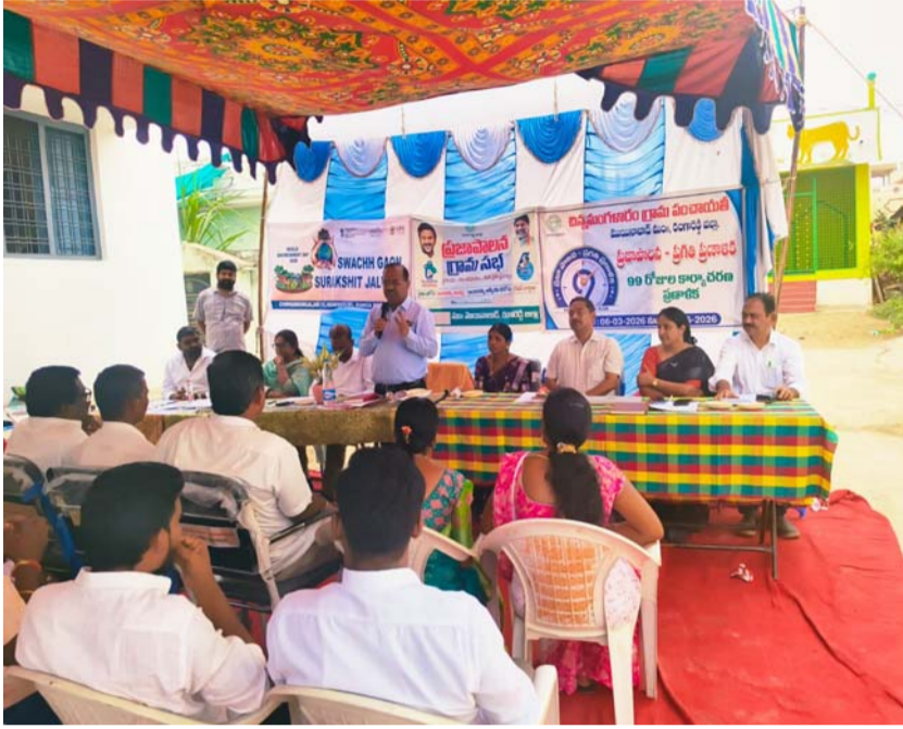
ప్రజాప్రతినిధులు మరియు గ్రామస్థులు పెద్ద సంఖ్యలో పాల్గొన్నారు.