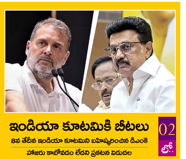
ఇండియా కూటమికి బీటలు 8వ తేదీన ఇండియా కూటమిని బహుభూరించిన డిఎంకే హాజరు కాబోవడం లేదని ప్రకటన విడుదల

సంపుటి: 13 | సంచిక: 267 | prajapatibha.2013@gmail.com | ఎడిటర్: దానూరి శ్రీనివాస్ | 9441500341 | వెల: రూ.5.00 | పేజీలు: 21