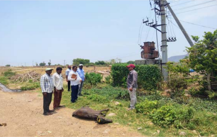
వీరూర్, జూన్ 4(ప్రజా ప్రతిభ)