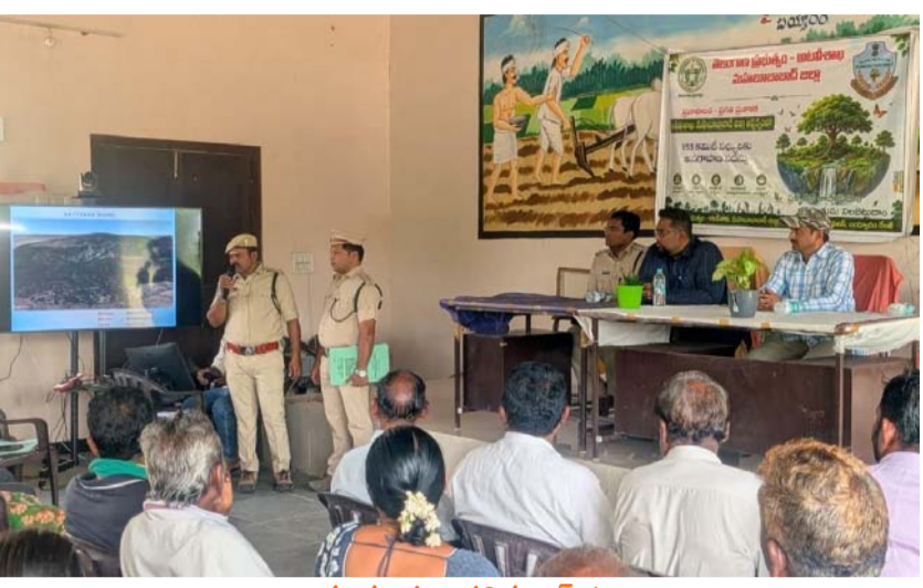
బయ్యారం, ప్రజా ప్రతిభ, జూన్ 4.