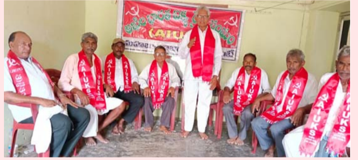
మహబూబాబాద్ జూన్ 4 (ప్రజా ప్రతిభ)

రైతుకు కావలసిన విత్తనాలను నాణ్యమైనవి అందించాలని కల్పి విత్తనాల గ్రూప్ ద్వారా చేయాలని అభిలషారత ఐక్య రైతు సంఘం రాష్ట్ర ఉపాధ్యక్షులు పాయం చిన్న చంద్రన్న అన్నారు. జిల్లా కేంద్రంలోని మాస్ లైన్ పార్క్ నేడు ఏర్పాటు చేసిన ఒక సమావేశానికి ముఖ్యఅతిథిగా హాజరై ప్రసంగించారు. ఈ సందర్భంగా చంద్రన్న మాట్లాడుతూ వర్షాకాలం సీజన్ ప్రారంభమైనది రైతాంగానికి అవసరమగు విత్తనాలను నాణ్యమైనవి సరిపడ అందుబాటులో ఉంచాలని అన్నారు. గ్రామీణ ప్రాంతాలలో ఇప్పటికే కల్పి విత్తనాలు రాష్ట్రమేలుతున్నాయని, పట్టణాదుగుల్లా పుణ్యకొస్తున్న విత్తన కంపెనీలు రైతులను మోసం చేస్తున్నాయని అన్నారు. ప్రభుత్వ అధికారుల తనిఖీలో దొరుకుతున్న సకీ విత్తన సరఫరాదారులపై క్రిమినల్ కేసులు పెట్టి కఠినంగా శిక్షించాలని చంద్రన్న అన్నారు. రైతాంగం ఆత్మాకలి పోయి అధిక దిగుబడులు పేరుతో మోసపోవడం ప్రతి విత్తన ప్యాకెట్ కు కల్పితంగా రేడు అడగడం అన్నారు. రైతాంగం ఎదుర్కొంటున్న ఎరువుల ధరలు తగ్గించాలని, బ్యాంకు రుణాలు సకాలంలో అందించాలని ఆమెరికా యూరప్ దేశాలలో వ్యవసాయ దిగుమతుల ఒప్పందాలను రద్దు చేయాలని తదితర డిమాండ్లతో అభిలషారత ఐక్య రైతు సంఘం జూన్ 1 నుంచి 6 వరకు మండల కేంద్రా 8న జిల్లా కలెక్టర్ కార్యాలయం ముందు ధర్నాలు నిర్వహిస్తున్నామని ఆయన తెలిపారు. మండల జిల్లా కేంద్రాల్లో జరిగే నిరసన కార్యక్రమాలలో రైతాంగం పెద్ద ఎత్తున పాల్గొని విజయవంతం చేయాలని ఆయన పిలుపునిచ్చారు. ఈ సమావేశంలో జిల్లా అధ్యక్షుడు పూసం ప్రభాకర్ జిల్లా ప్రధాన కార్యదర్శి అప్పల కట్టయ్య, దుగుల రాములు ఈక బిక్సం గర్డల వెంకటయ్య, బూర్గల మోష తదితరులు ఈ సమావేశంలో పాల్గొన్నారు. పలు రైతాంగ సమస్యలపై సమావేశం తీర్మానాలను ఆమోదించింది.