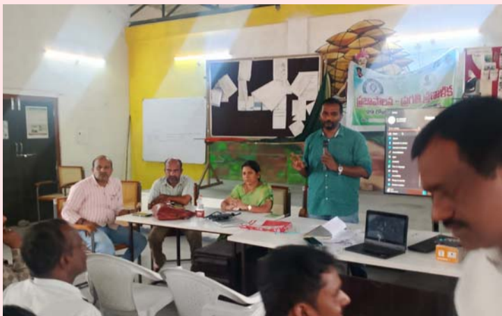
మేడ్చల్ ప్రతినిధి, జూన్ 04 (ప్రజా ప్రతిభ)