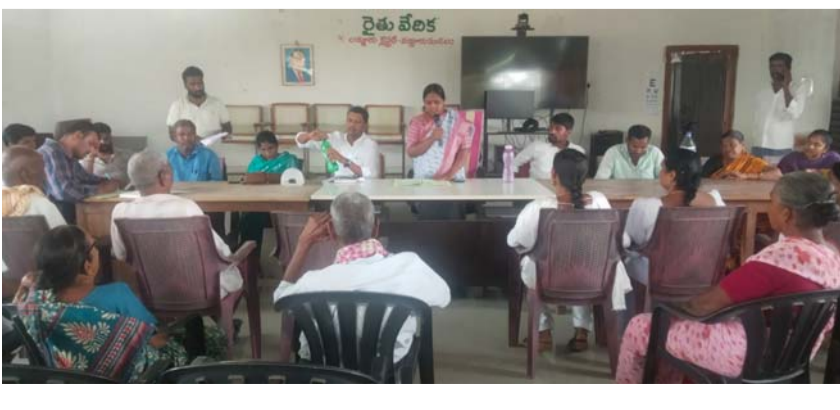
ఇందిరమ్మ ఇండ్ల లొల్లి...