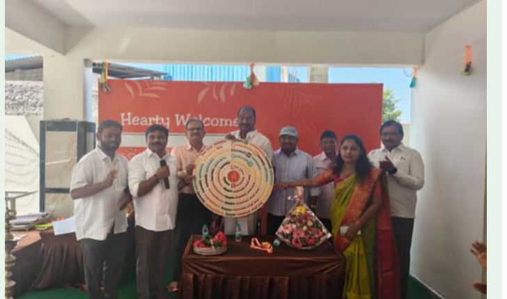
ఎల్సీ, నగర్, జూన్ 4