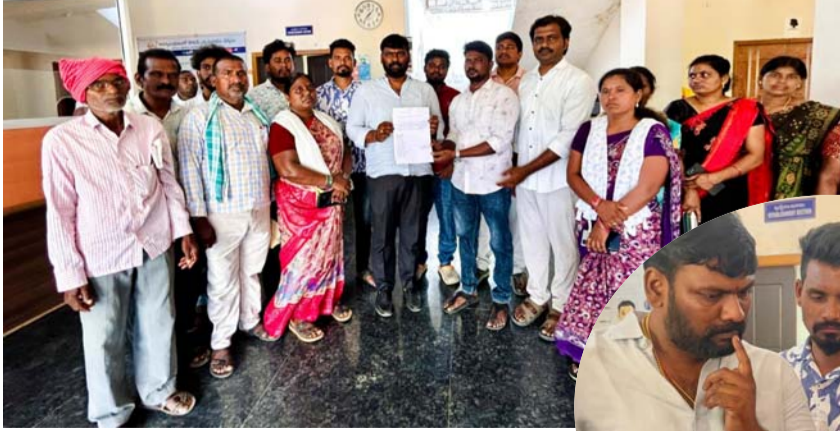
హుజూరాబాద్ ప్రతినిధి, జూన్ 04, ప్రజా ప్రతిభ:

పోరాటంలో ముందున్న నాయకులకు మొండిచేయి... దళిత బంధు రెండో విడత మంజూరు కోసం మీడియా సమావేశం. జమ్మికుంట మున్సిపల్ చైర్మన్ ను కలిసి వివేక పత్రికాని అందించిన దళిత బంధు సాధన సమితి.