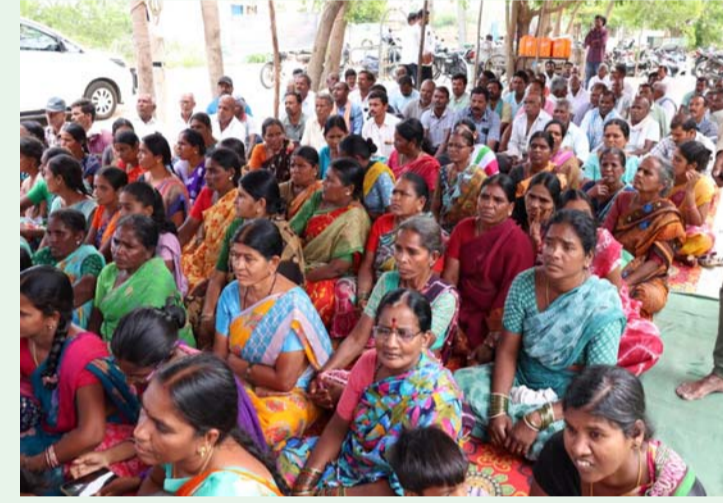
కామారెడ్డి, జూన్ 4:-